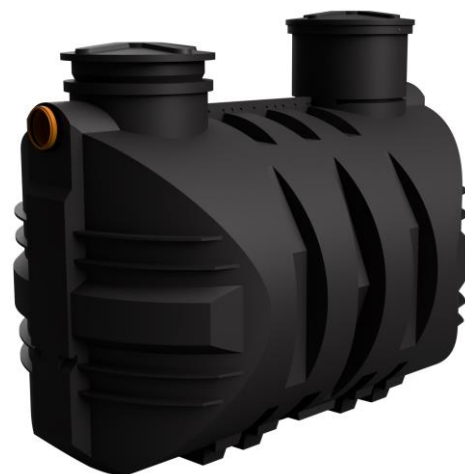
Zbiornik 4000l M