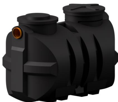
Zbiornik 2000l M