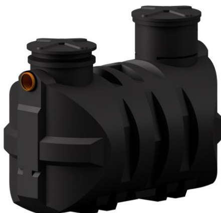
Zbiornik 3000l M